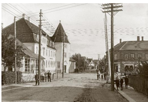
Glamsbjerg Hotel 1920