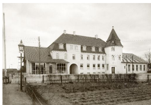
Glamsbjerg Hotel 1917