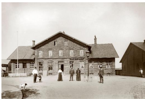
Gästgivergaard (bygget 1884) i 1905