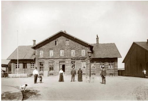
Gæstgivergaard (bygget 1884) i 1905