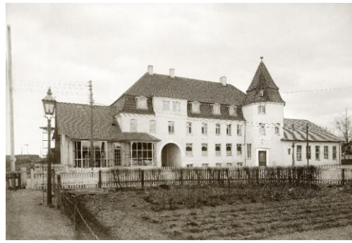
Glamsbjerg Hotel 1917